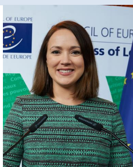
Vice-présidente de la Chambre des pouvoirs locaux Liisa Ansala, Finlande