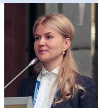
Vice-présidente de la Chambre des régions Yuliya Svitlychna, Ukraine